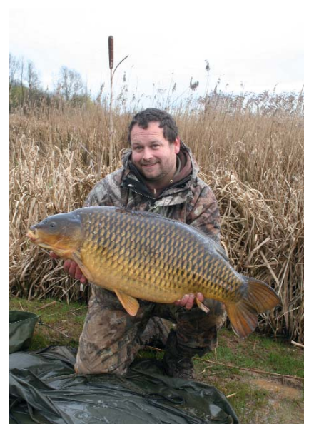
Crap comun mare de apă rece